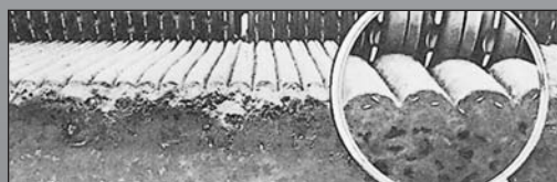
Le rouleau arrière enfouit à une profondeur contrôlée de 12 mm maximum