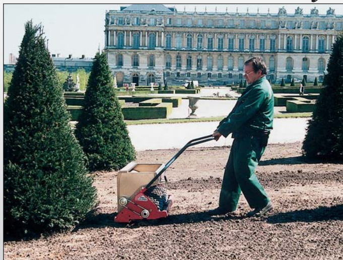
Semis sur petits chantiers avec le Seedy