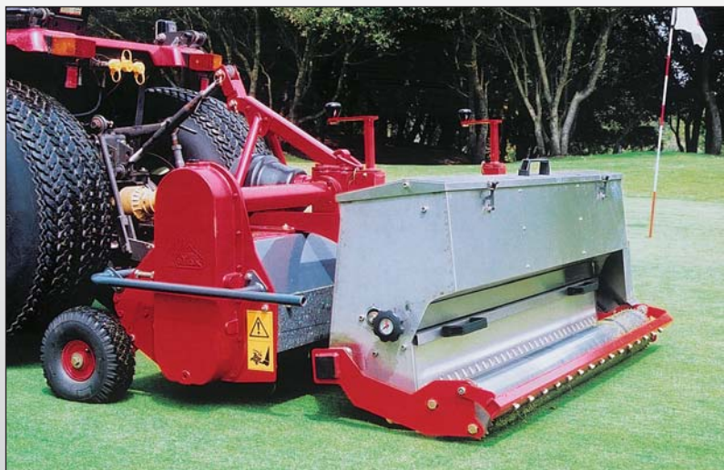
Régénérateur regarnisseur CR 140 sur greens de golf