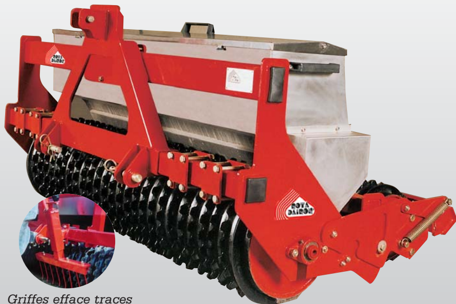
Griffes efface traces